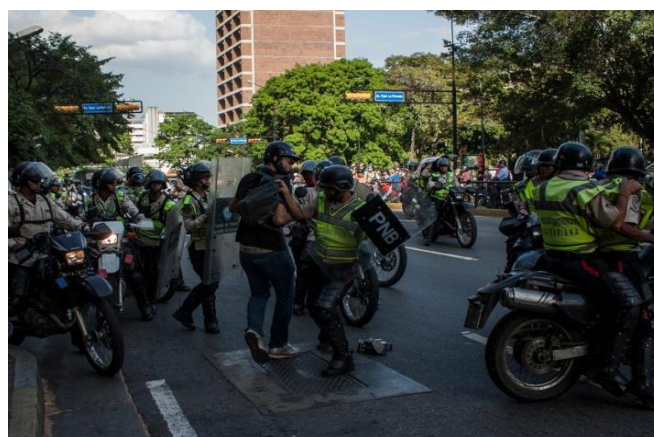
PNB contra Siciliano.

“A un compañero fotógrafo lo agarraron, lo estaban golpeando yo me acerqué para hacer esas fotos y vinieron por mí... Yo salí corriendo, me monté en la acera y ahí venían pasando otros PNB en moto y con el escudo me lanzaron contra un kiosco, cuando caí en el piso otros dos policías pasaron y me patearon”, explicó el reportero Peña cuyo instrumento de trabajo, su cámara fotográfica, sufrió algunos golpes también 10 . Junto con Rayner Peña, fue agredido Horacio Siciliano , fotoperiodista que en la cobertura estaba colaborando para Univisión.